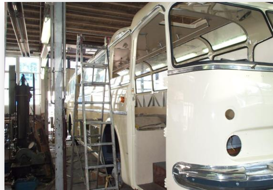
während des Wiederaufbau's „Blick auf Außenbereich des Fahrzeuges“