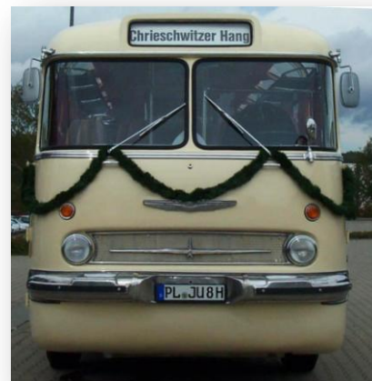
zum Umzug 100 Jahre Straßenbahn Plauen am 12.09.2004