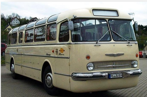
nach Fertigstellung 200