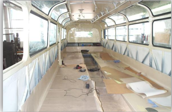
während des Wiederaufbau's „Blick in den Innenbereich des Fahrzeuges“